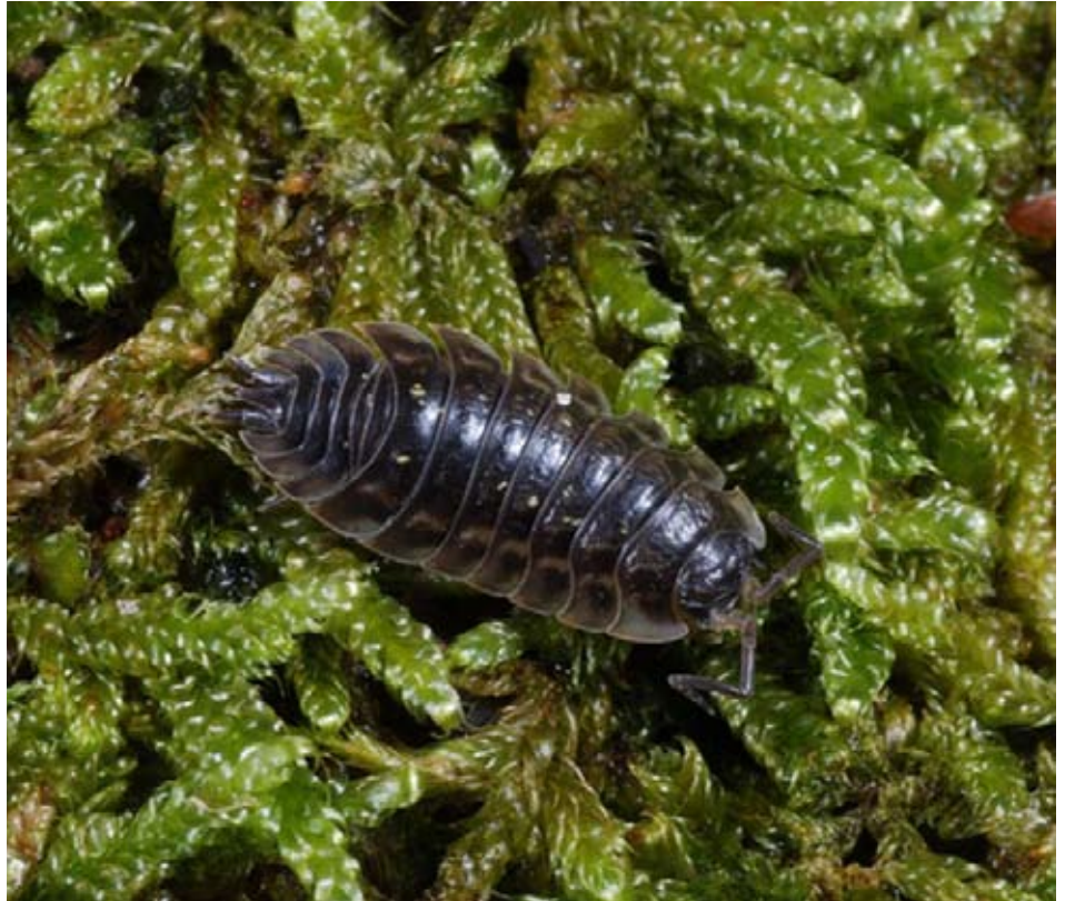
En grå bænkebidere.

bænkebidere masser af steder. De kan bo under sten, blade, urtepotter, bark, brædder i kældre og lignende steder, hvor de holder sig fugtige og skjult om dagen. Hvis bænkebidere er for længe et sted, hvor der ikke er fugtigt, tørrer de ud og dør.