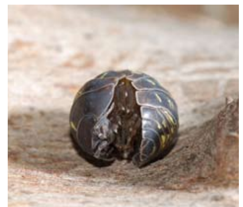
Kuglebænkebidere ruller sig sammen og forsøger at ligne en lille sten.

Bænkebidere er ikke farlige og ødelægger ikke havemøblerne. På trods af deres navn, gnaver de ikke løs på træet, og de kan ikke betragtes som skadedyr, selv om de kan spise lidt af agurkerne i drivhuset. Hvis I har mange bænkebidere i huset, kan I fange dem med en fælde og lukke dem ud i haven.