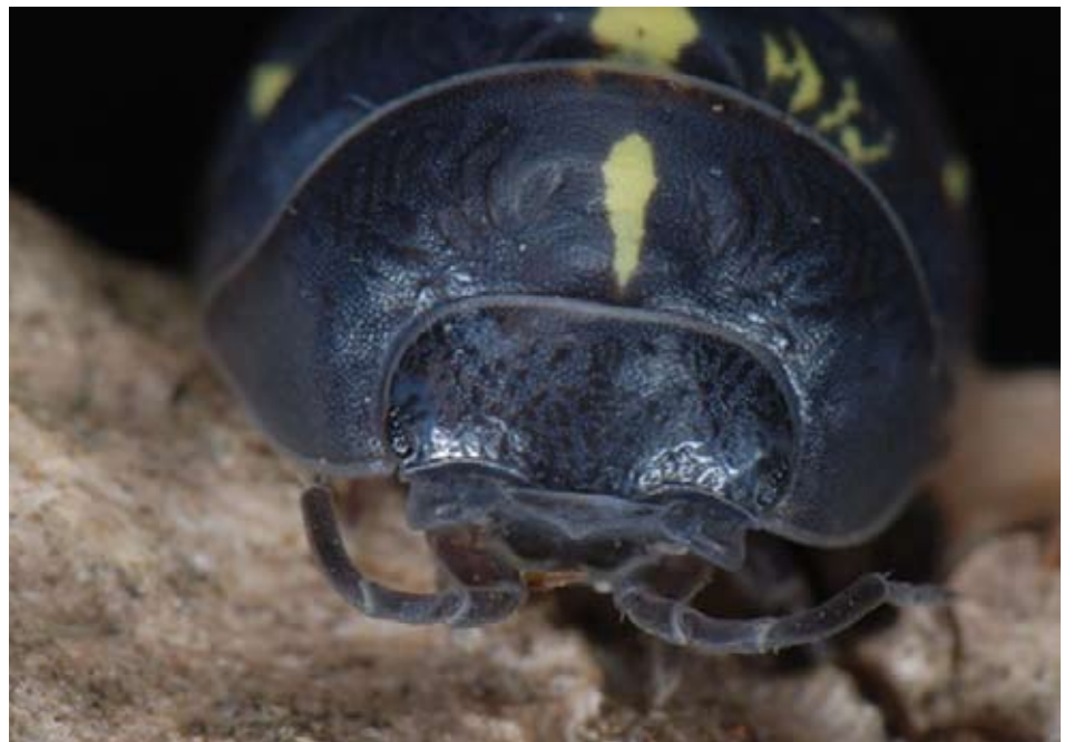
Portræt af en kuglebænkebidder.