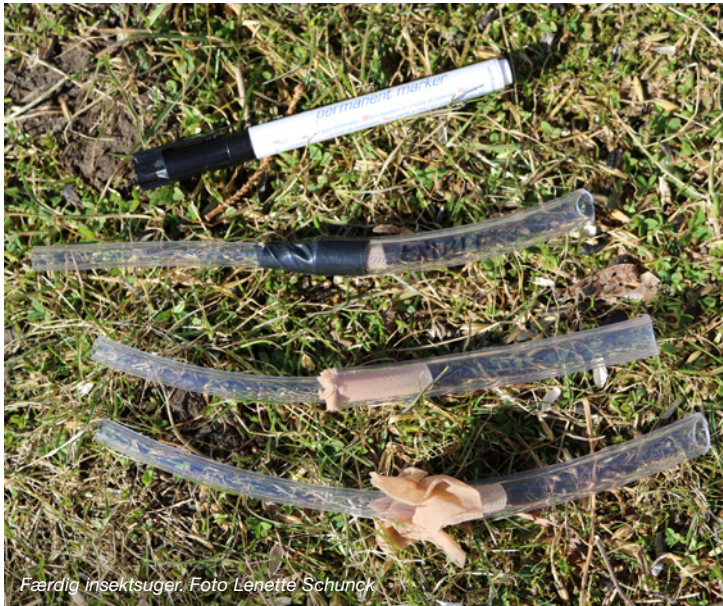
Færdig insektsuger.