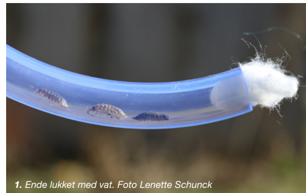
1. Ende lukket med vat.